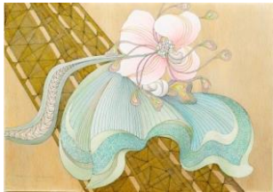
Ilna Ewers-Wunderwald, Magnolie, 1955, 42 x 29,8 cm