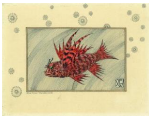
Ilna Ewers-Wunderwald, Rotfeuerfisch, um 1905, 25 x 19 cm