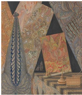
Ilna Ewers-Wunderwald, Opium, 1929, 50 x 57 cm