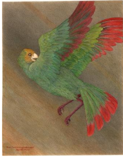
Ilna Ewers-Wunderwald, Angst, 1955, 32 x 41 cm