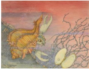
Ilna Ewers-Wunderwald, Einsiedlerkrebs, 1953, 40,5 x 31 cm